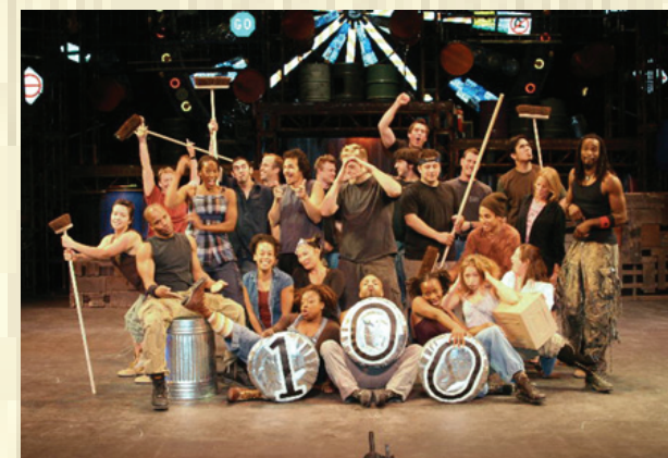
Stomp. Fuente: imágenes de Google